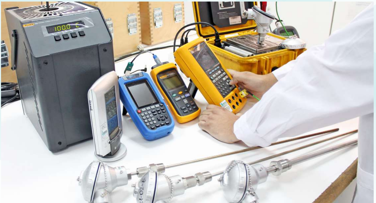
CALIBRACIÓN DE TRANSMISOR / FOTOGRAFÍA DEL LABORATORIO DE INDUTECNICA

Puede usted consultar en el sitio www.inn.cl , acreditación, en el Directorio de organismos acreditados.