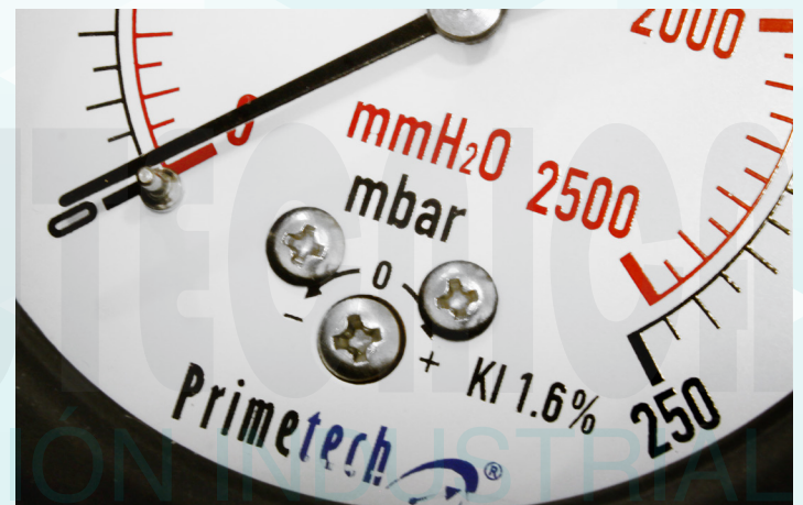
TORNILLO DE AJUSTE

* Otras aplicaciones se deben consultar.